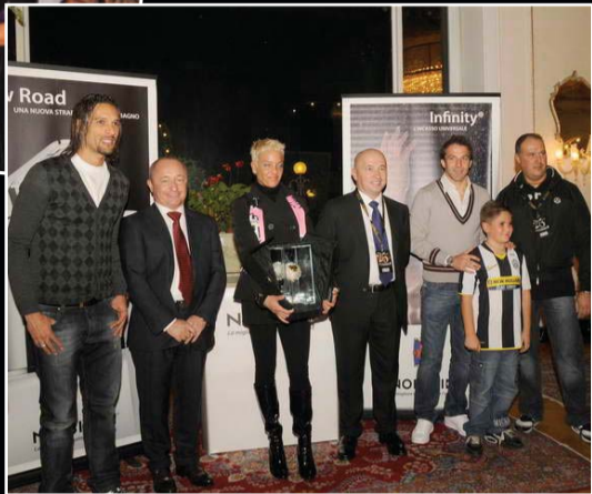
AMAURI E DEL PIERO CON GLI SPONSOR NOBILI