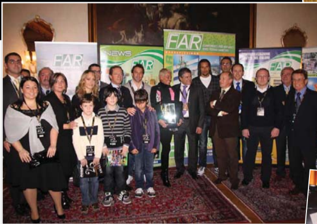
LO SPONSOR UFFICIALE FAR CON LA CASTAGNA D'ORO AMAURI